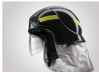
헬멧 내부로 개폐가능한 렌즈