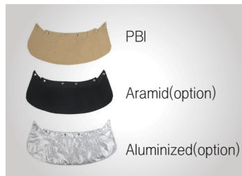
교체 가능한 물받이