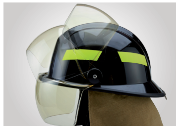
헬멧 외부로 개폐가능한 렌즈