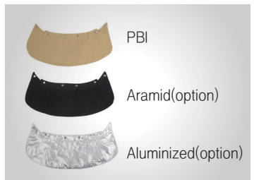
교체 가능한 물받이